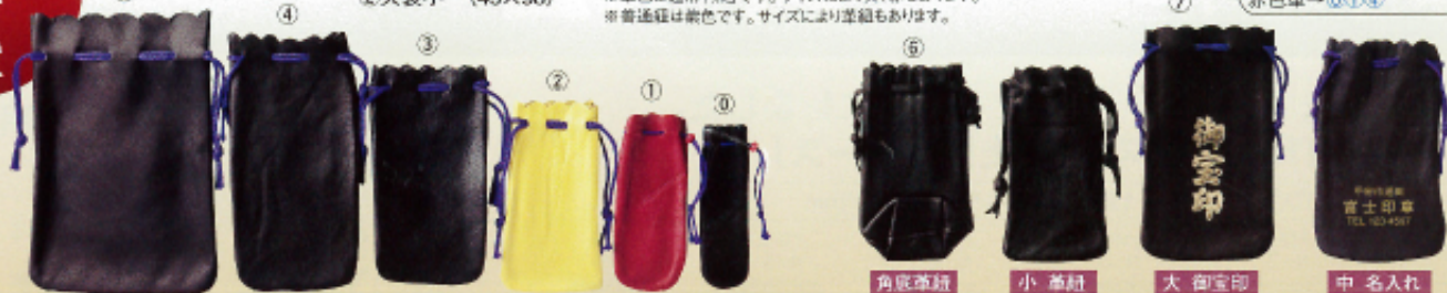
角底革紐 小革紐 大御宝印 中名入れ

角底→角印用印袋 普通紐・革紐 革紐・引紐が革製 ①②③④⑥ 名入れ→全品可 黄色革→①②③④ 赤色革→⑩⑪